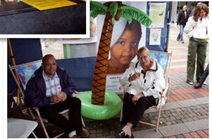
Cocktailpause - Besucher der Jazztage 2009 in Gelsenkirchen

Unterstützen auch Sie diese Aktion, und genießen Sie fair gemixte Cocktails wie Cuba Libre, Mojito und Caipirinha. Das bedeutet: Sie feiern, während wir Sie mit coolen Drinks verwöhnen, und so helfen wir gemeinsam. Dank des sozialen Engagements unserer Barkeeper ist es