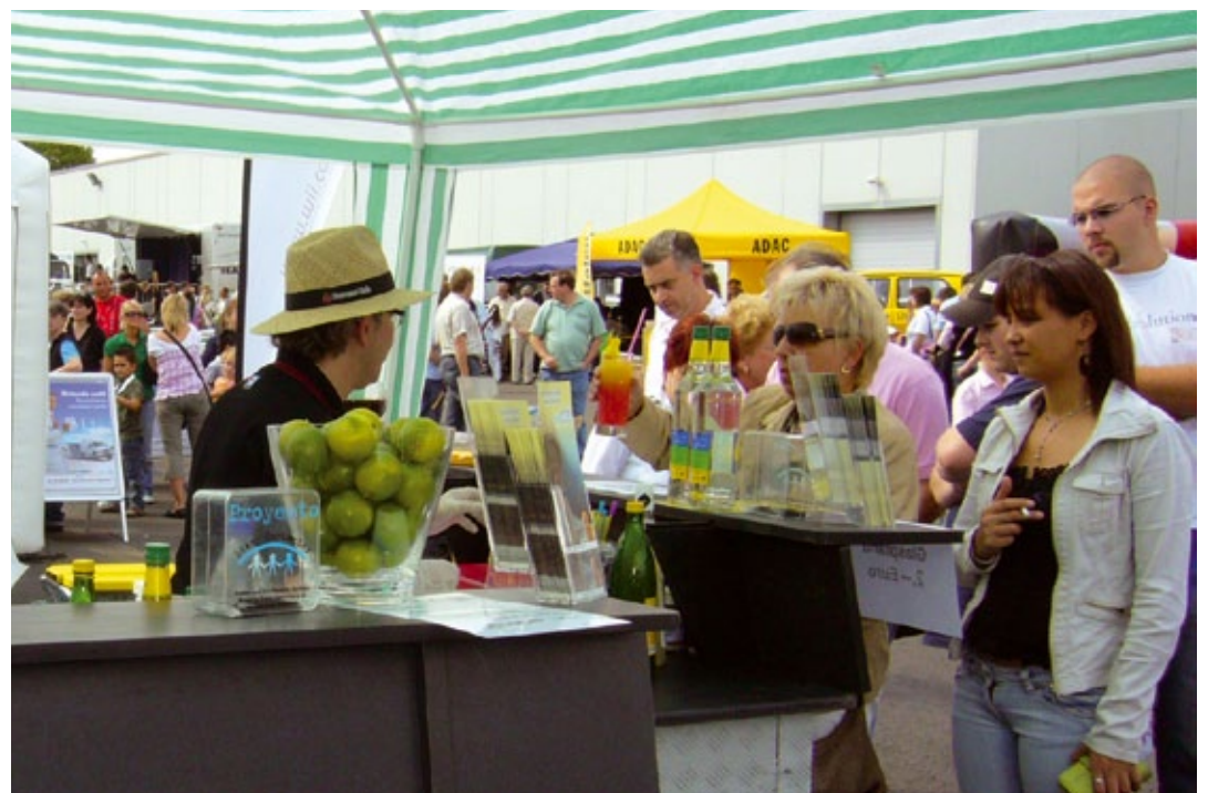
Kühle Drinks bei den Sicherheitstagen in Gelsenkirchen

kleine Party oder Großevent, ob privat oder geschäftlich - mit den „Coolen Cocktails“ liegen Sie immer richtig.