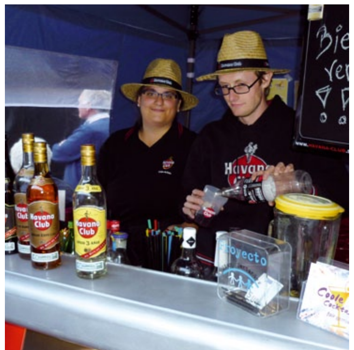
Cocktails mixen für den guten Zweck ( www.coolecocktails.de )

te Personal und Cocktailbar, so dass ein Erlös von 725,50 EUR in den Aufbau und den Erhalt der KITA's in Kuba fließen konnte.