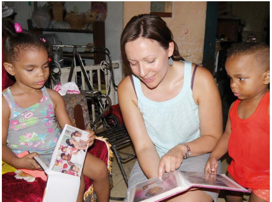
Gemeinsam wurden Fotos angeschaut.

Wie viele andere Familien, die durch das