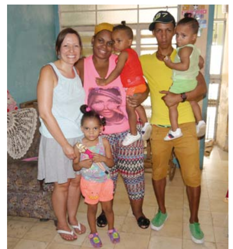
Viel Freude beim ersten Familientreffen

des Kindergartens und insbesondere die Kinder dort empfangen uns herzlich. Wir erfuhren viel über das Projekt und die direkte Hilfe vor Ort. Oft leben die Familien hier unter einfachsten Bedingungen und auf engstem Raum zusammen. Die Familien im Projekt werden regelmäßig besucht, um zu