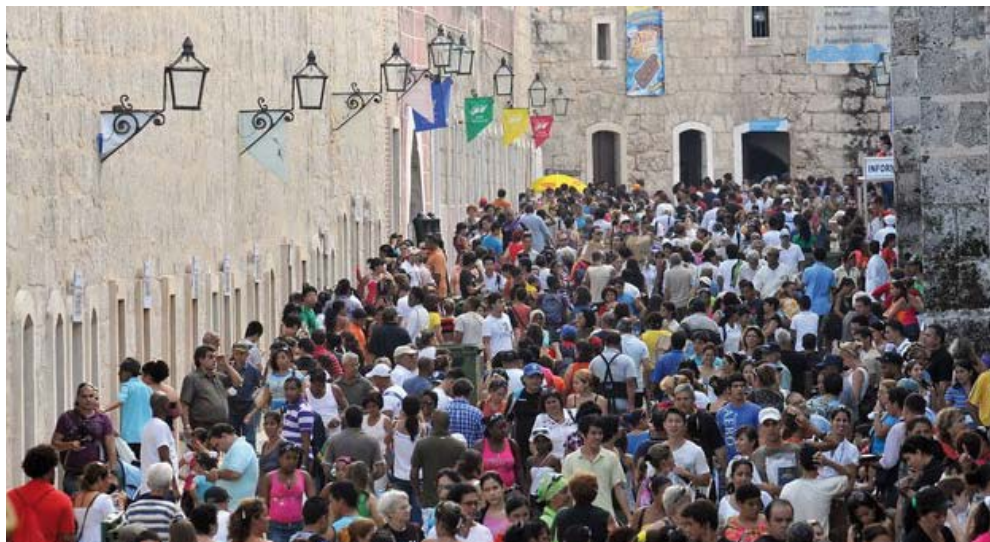
Großer Andrang bei der Buchmesse in Havanna.