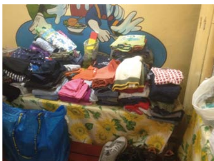
Die Auswahl war groß.