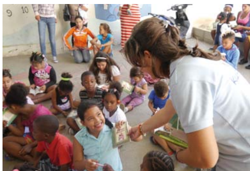
Bücher für Kinder – auch 2017 wieder

All diese genannten Fähigkeiten, Kenntnisse und Fertigkeiten sind von besonders großer Bedeutung für die schulische Laufbahn der Kinder, wobei es auch von Wichtigkeit ist, dass sie erfahren, dass Lesen keine einsame, sondern eine gemeinschaftliche Tätigkeit ist. Dies ist beim Betrachten von Bilderbüchern und gleichfalls beim Vorlesen der Fall, und natürlich sollte auch später das gemeinsame Lesen nicht zu kurz kommen. Auch wenn ältere Kinder das Alleinlesen vorziehen, freuen sie sich doch, über das Gelesene ins Gespräch zu kommen. ★