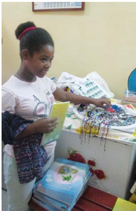
Vor allem der Schmuck war bei den Mädchen heiß begehrt.