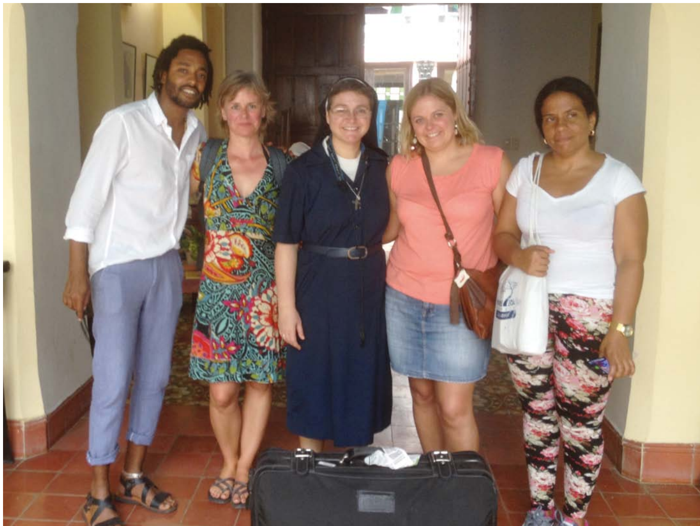
Spendenkoffer-Übergabe im Kindergarten in Havanna Vieja